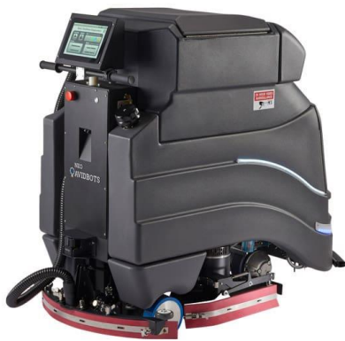
Avidbots Neo Cleaning Roboter

Avidbots Neo Roboter ist ein autonom fahrender Reinigungsroboter, welcher von Grund auf für maximale Reinigungsleistung und Produktivität entwickelt wurde. Neo bewältigt die anspruchsvolle Aufgabe der Bodenreinigung und gibt Ihrem Reinigungspersonal die Möglichkeit sich auf wertvollere Aufgaben zu konzentrieren. Neo reduziert Müdigkeit, Fehler und Verletzungen, welche sonst durch die wiederholte Belastung für Ihr Reinigungspersonal entsteht.