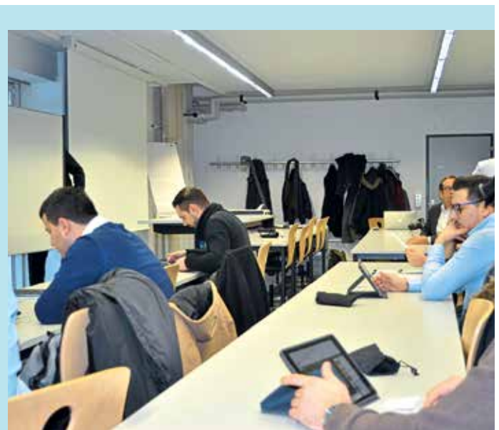
Mitarbeitende von GammaRenax und Vebege absolvierten als Erste der Branche das Objekt-Manager-Assessment.